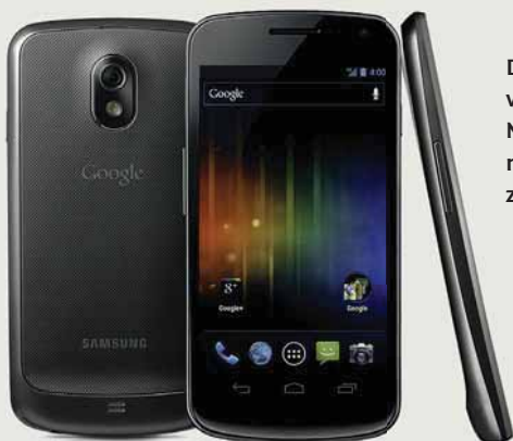
Das Samsung Galaxy Nexus ist das erste Smartphone mit Android 4.0 und hat einen NFC-Chip an Bord