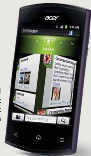
Das Acer Liquid Express kann mit NFC ausgerüstet werden