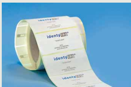
Winckel bietet unter der Marke identitytag ab sofort ein komplettes Portfolio von NFC-fähigen Smart Tags und Labels an

WLAN (Wifi): basiert auf dem IEEE-Standard 802.11a/b/g/n und arbeitet im 5-GHz- und/oder 2,4-GHz-Frequenzband mit einer Datenübertragungsrate von max. 600 Mbit/s (802.11n).