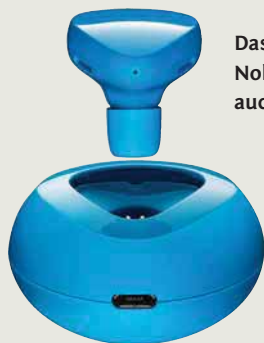
Das Design-in-Ear-Headset Nokia Luna Bluetooth unterstützt auch die NFC-Technik

Mit Hilfe des kürzlich von NXP Semiconductors vorgestellten Chips zum Einsatz in Autoschlüsseln können diese per NFC-Technik mit z. B. NFC-Handys oder -Tablets kommunizieren. Damit ist eine Vielzahl neuer Anwendungen für Autoschlüssel denkbar, beispielsweise Routenplanung, Selbstdiagnose, das Hinterlegen von Kundendienstdaten, der Dialog mit Serviceprogrammen sowie eine Positionsbestimmung.