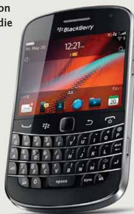
Das BlackBerry Bold 9900 wurde bereits von Mastercard für die mobile Zahlung zertifiziert