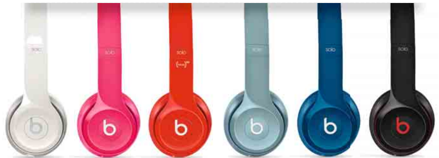
Solo2-Familie von Beats

K opfhörer sind bereits seit geraumer Zeit ein Wachstumsmarkt. Besonders durch die stetige Verbreitung von Smartphones bleibt dieser auch in Bewegung. Das hat eine Umfrage im Auftrag des Bitkom (Bundesverband Informationswirtschaft, Telekommunikation und neue Medien e. V.) bestätigt. Demnach setzt jeder zweite Nutzer (54 Prozent) seine Kopfhörer in Verbindung mit einem Smartphone auf. Weitere 19 Prozent verbinden sie mit einem herkömmlichen Handy. An der klassischen Stereoanlage (33 Prozent), dem Desktop PC (23 Prozent) oder dem Fernseher (14 Prozent) werden Kopfhörer weiterhin genutzt. „Sprachsteuerung per Headset sowie die vielen verschiedenen Musik-Apps, etwa von Streaming-Anbietern, machen Kopfhörer für viele zum wichtigsten Smartphone-Zubehör“, sagt Timm Hoffmann, Audioexperte beim Bitkom. Unter jüngeren Menschen findet sich daher kaum jemand, der keine Kopfhörer nutzt: 93 Prozent der 14 bis 29-Jährigen setzen sie auf. Auch bei den 30 bis 49-Jähri-