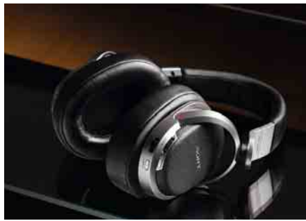
MDR-HW700DS von Sony

Für Kunden, die einen Kopfhörer für zu Hause benötigen, gibt es von Sony eine interessante Lösung. Das weltweit erste drahtlose 9.1-Kanal-Digital-Surround-Kopfhörersystem MDR-HW700DS (UVP: 449,00 €) vereint guten Klang mit Tragekomfort. Ge-